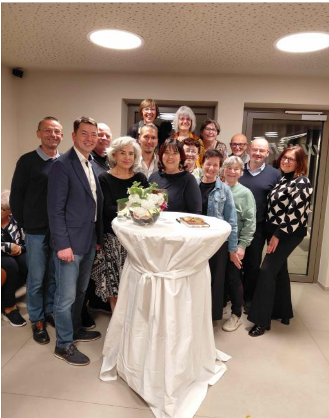
Brigitte Karner mit den Organisatoren von Kultur Initiative Kirchbach & Öffentliche Bücherei Kirchbach

Die Kultur Initiative Kirchbach lud in Kooperation mit der öffentlichen Bücherei Kirchbach die Schauspielerin Brigitte Karner zu einer Lesung nach Kirchbach ein. Die aus Film und Fernsehen bekannte Schauspielerin las aus ihrem Buch „Mein Leben ohne ihn“, in dem sie ihre Zeit nach dem Tod ihres Mannes Peter Simonischek beschreibt. Sie erläuterte mutig und unkonventionell wie schwer das Zurückbleiben sein kann und wie das Leben weiter geht. Brigitte Karner sorgte mit ihrer sympathischen und einladenden Ausstrahlung dafür, dass der Abend für die vielen Besucher im überfüllten Foyer der Kirchbacher Halle zu einem besonderen Erlebnis wurde. Wir bedanken uns sehr herzlich für den Besuch und den unvergesslichen Abend.