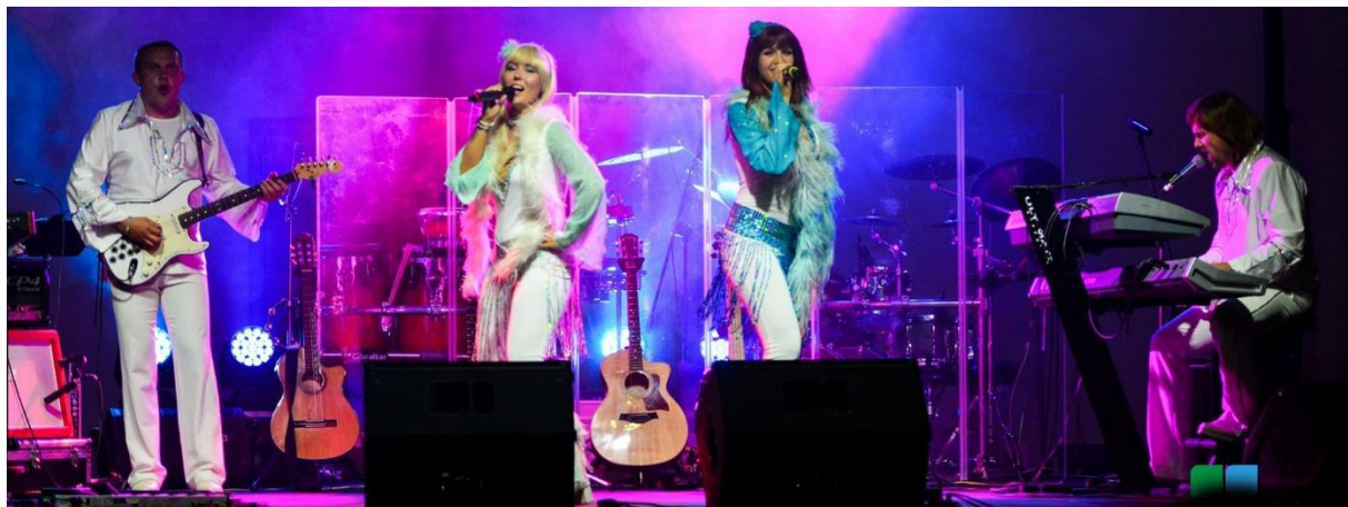
Abba